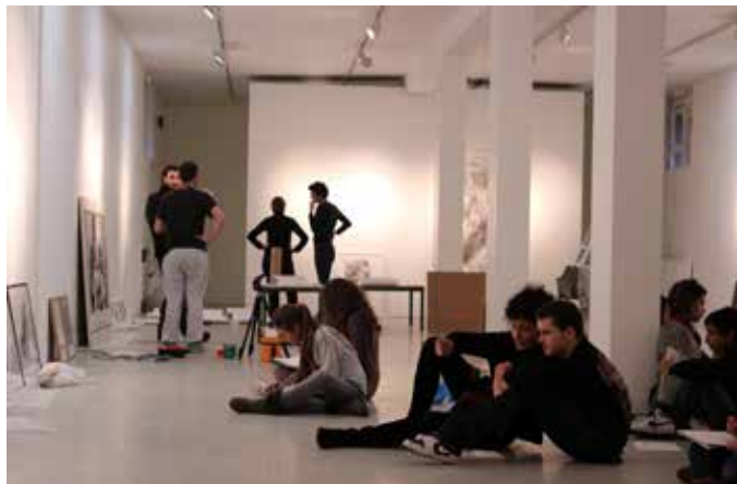
«L'envers de l'endroit» pendant le montage de l'exposition Ricochet 1 dessins en 2013