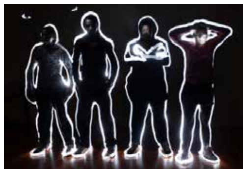
Travaux des élèves

Le projet «Light Painting» est le fruit d'un partenariat entre deux professeurs, de Lettres et de vente, du lycée Camille Claudel avec la Galerie municipale Jean-Collet associée à l'Exploradôme, musée de découverte des sciences, du multimédia et de l'éducation au développement durable de Vitry.