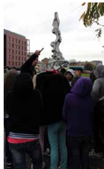
Présentation de « Chaufferie avec cheminée » de Jean Dubuffet, carrefour de la Libération et réalisations des enfants