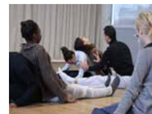
Présentation du projet et exercices de lâcher-prise

En décembre 2012, deux danseurs du prestigieux Opéra de Paris se sont investis dans un programme initié par le RIL (Relais Innovant Lycéen) et la Galerie municipale Jean-Collet à destination de jeunes adultes en décrochage scolaire (garçons et filles âgés de 16-18 ans) des lycées d'Ivry et de Vitry. Les deux fois 2 heures d'atelier de pratique de la danse se sont déroulées dans les salles adaptées de l'Académie de danse des EMA à Vitry.