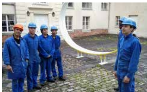
Du dessin à la réalisation et à la présentation

Cette action pédagogique a été conduite pendant la présentation de l'exposition Deux pièces meublées à la Galerie municipale explorant la relation mobilier sculpture installation.