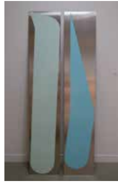
Benoît Géhanne, Projection #14 , 2013 laque sur aluminium, 2 plaques de 200 x 38 cm