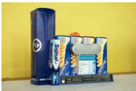
Paul Pouvreau Sans titre, 2011 95 x 120 cm