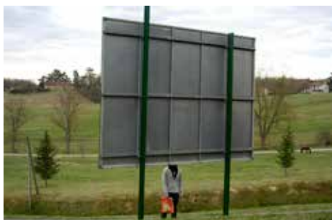
Paul Pouvreau Le cadeau (Mirande), 2008 80 x 120 cm