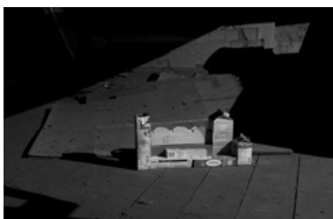
Paul Pouvreau Sans titre, 2012 80 x 120 cm