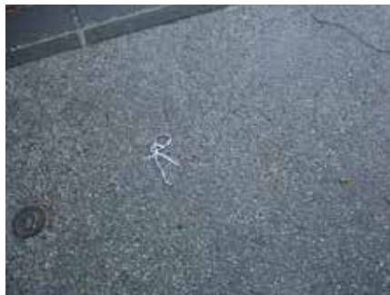
Paul Pouvreau Alpha, 2008 (R) 40 x 50 cm