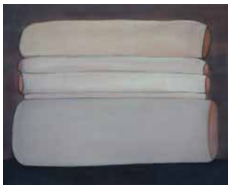
Julia Scalbert Sans titre, 2014 Acrylique sur toile, 100 x 80 cm