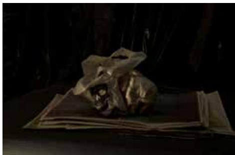
Passé simple , 2014 Photographie N/B, 62 x 84 cm

« Depuis quelques années, plusieurs composantes de mon travail entretiennent des relations assez étroites avec le volume et l'architecture. Cet intérêt s'exprime à la fois par la réalisation de photographies conçues comme une scène construite ou architecturée, dans lesquelles se confrontent les données du réel avec des objets rapportés, généralement des emballages. Cette mise en place de signes divers s'active ainsi dans les photographies de relations plurielles créant des zones d'interférences et ambivalentes entre le naturel et le fabriqué, le réel et la fiction, le sujet et l'objet. »