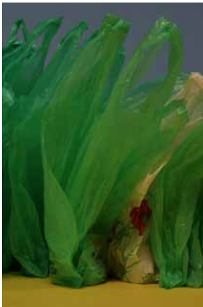
Paul Pouvreau Variations saisonnières, 2015