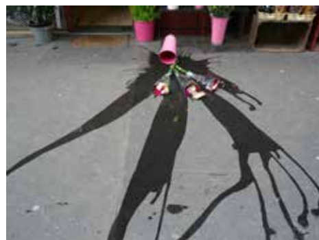
Paul Pouvreau Sans titre, 2009 48 x 58 cm