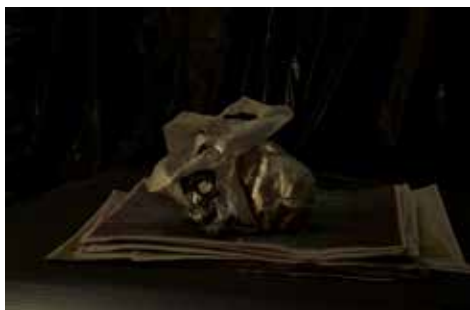
Paul Pouvreau Passé simple, 2014 62 x 84 cm