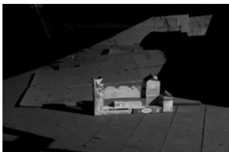
Sans titre , 2012 Photographie N/B, 80 x 120 cm

Deux œuvres de Paul Pouvreau, Sans titre , 2012 et Passé simple , 2014 ont récemment rejoint la collection.