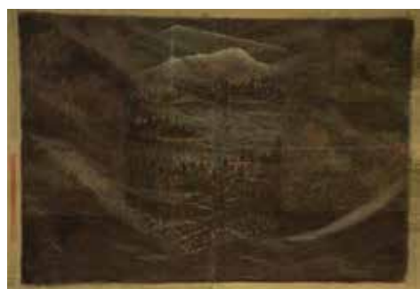
Paul Pouvreau Land box, 2013 Dessin au stylo bille sur papier journal 49 x 65 cm