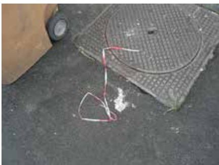
Paul Pouvreau Alpha, 2008 (d) 40 x 50 cm