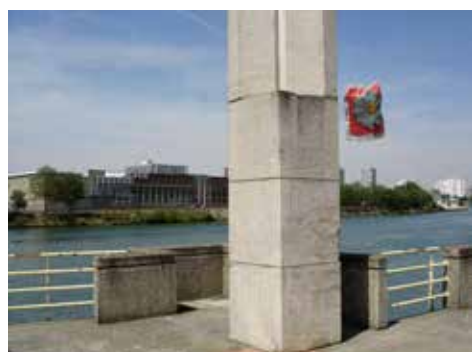
Paul Pouvreau Etendard, 2007 92 x 115 cm