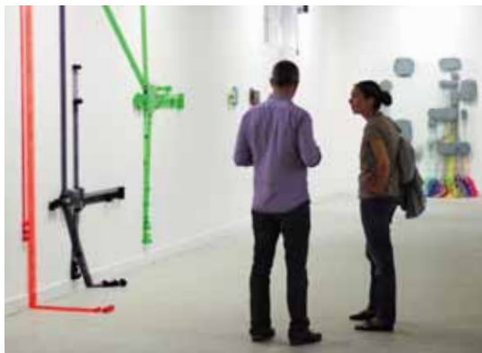
..... Vue de l'exposition des lauréats 2009, œuvres de Erwan Ballan.

Les deux œuvres primées en novembre, que l'on retrouve dans l'exposition, entrent dans la collection Novembre à Vitry aujourd'hui constituée de 83 pièces.