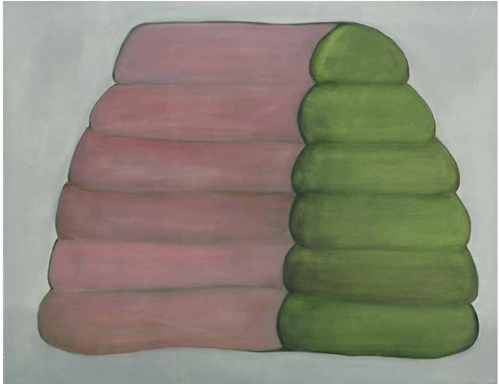
Sans titre , 2013 Acrylique sur toile 80 X 100 cm