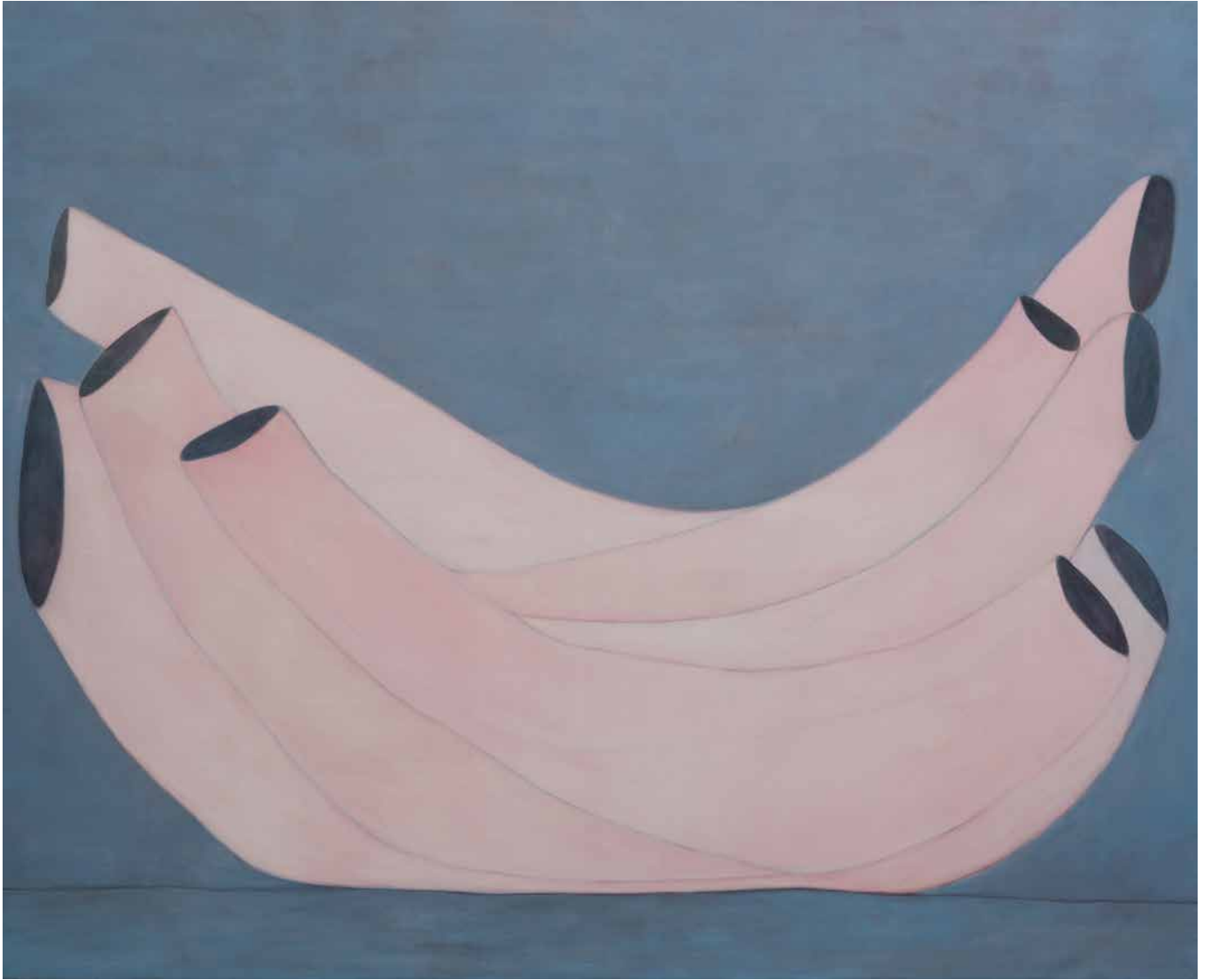
Sans titre , 2016 Acrylique sur toile 165 x 135 cm