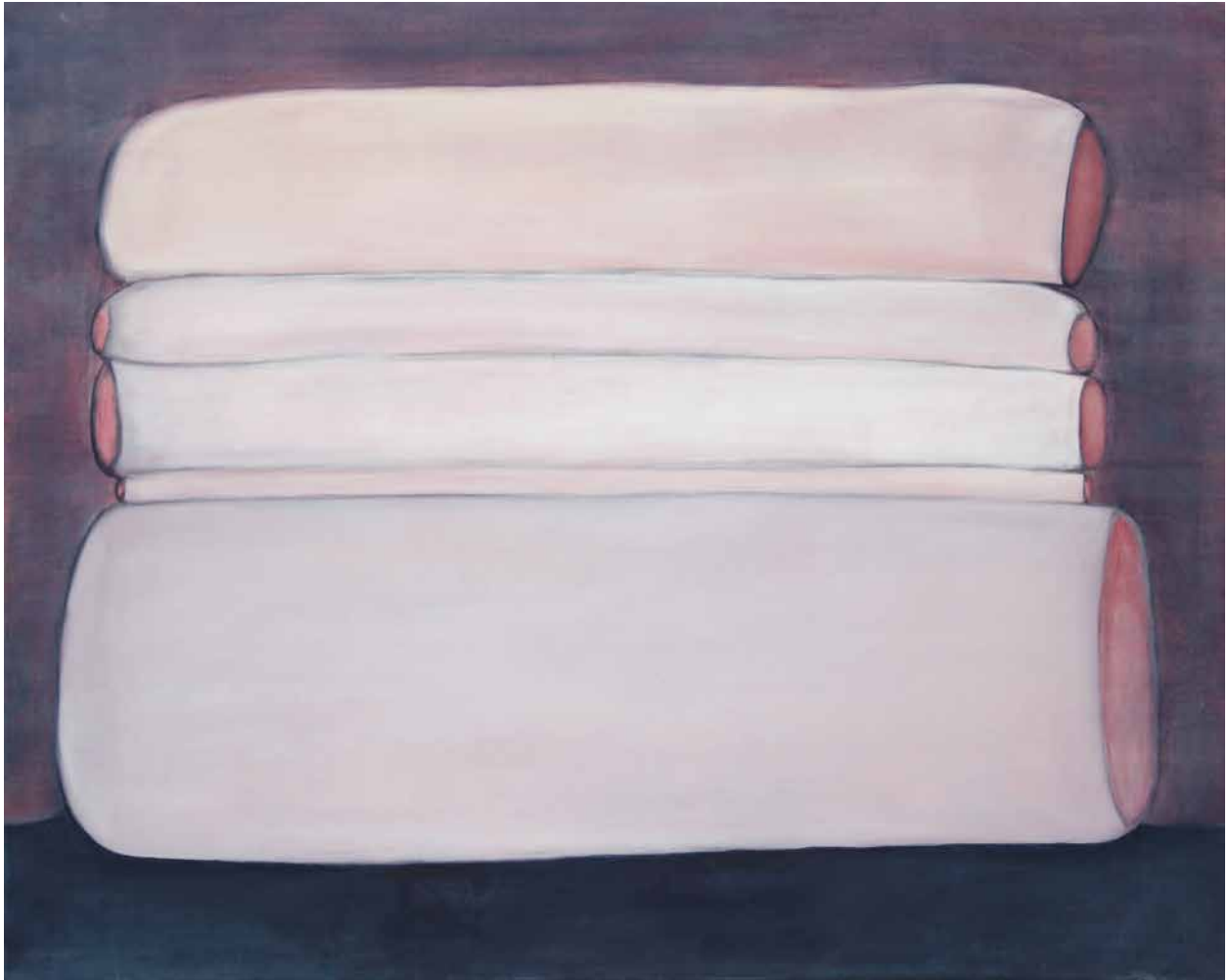
Sans titre , 2014 Acrylique sur toile 80 x 100 cm Collection ville de Vitry-sur-Seine