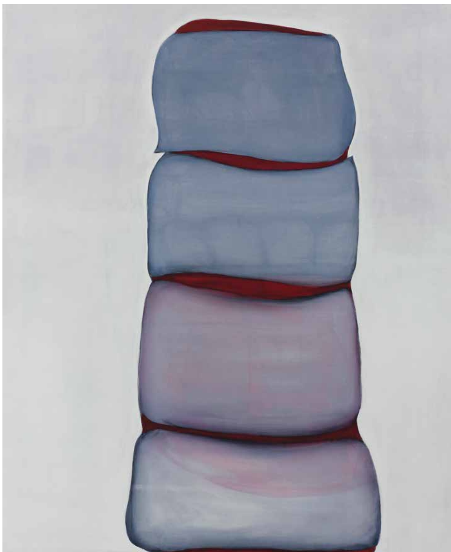
Sans titre , 2011 Acrylique sur toile 170 x 140 cm