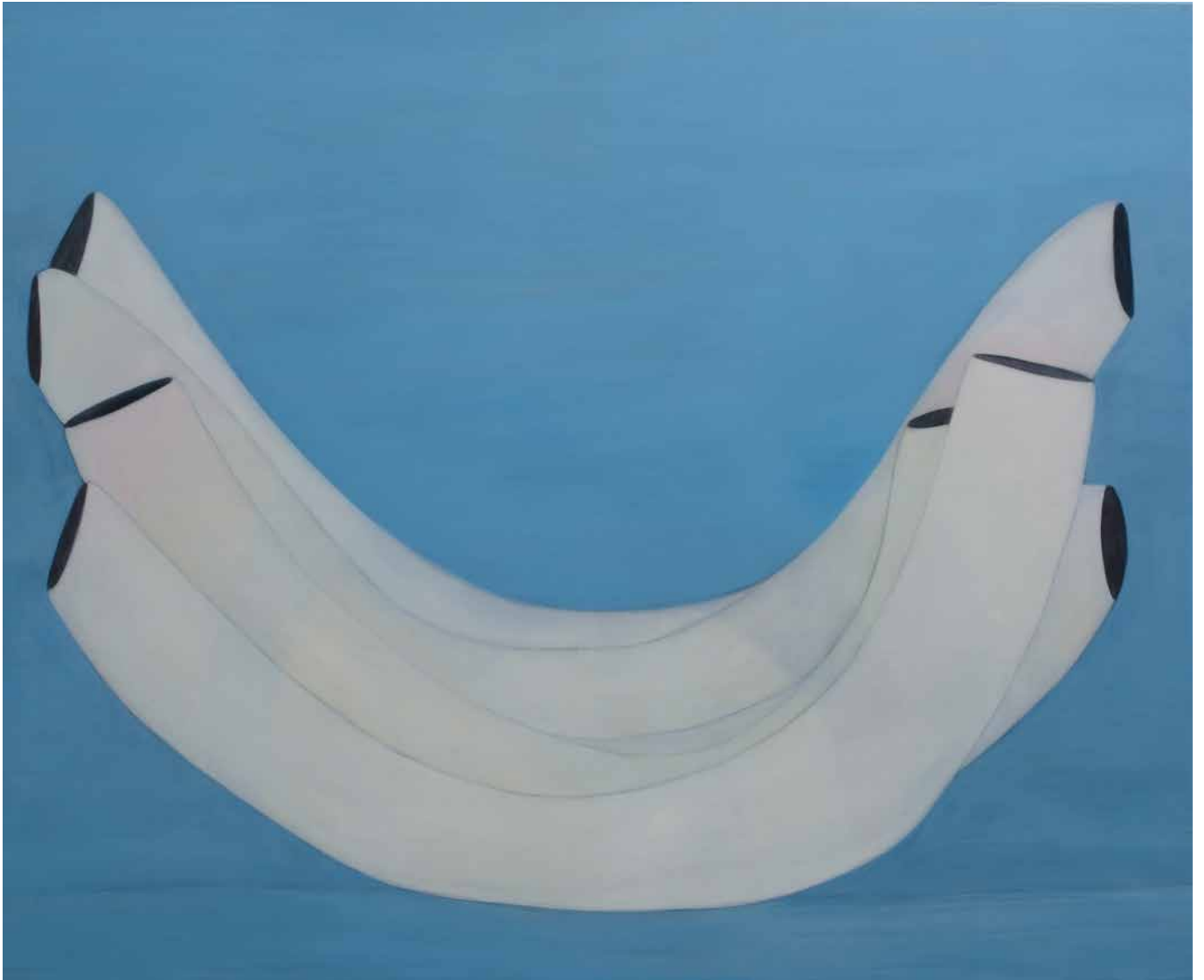
Sans titre , 2016 Acrylique sur toile 165 x 135 cm