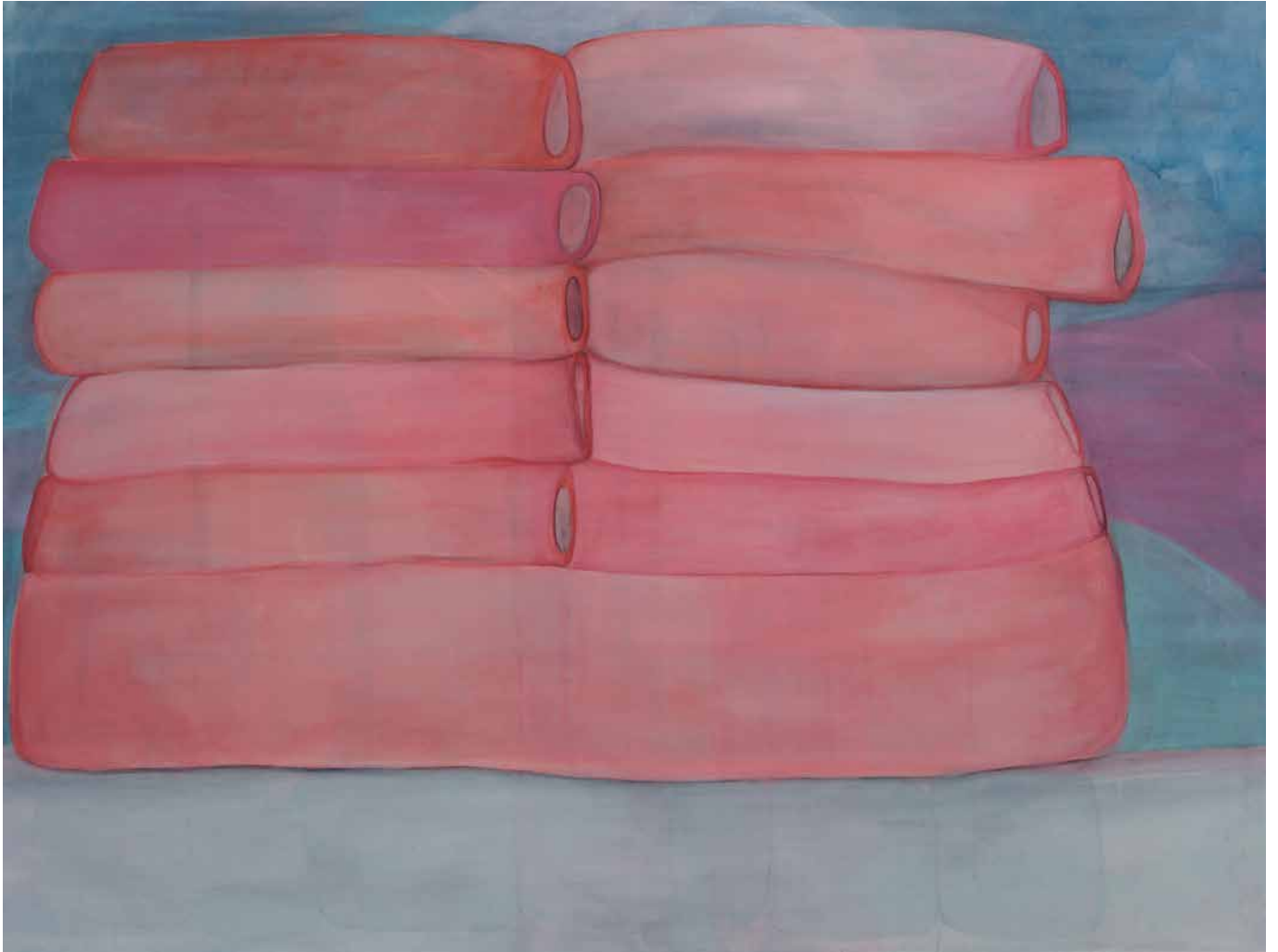
Cher Philip , 2013 Acrylique sur toile 170 x 130 cm