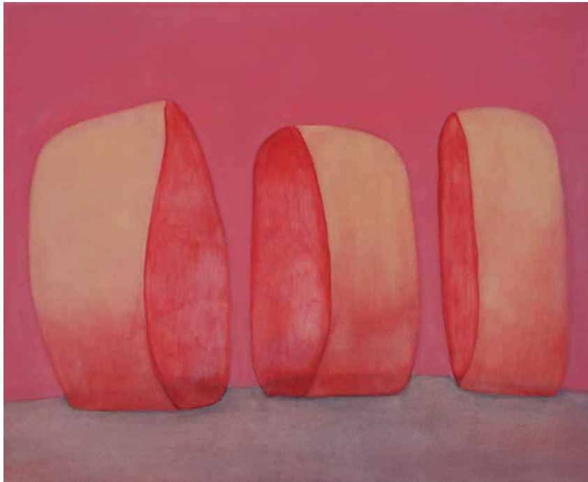
Sans titre , 2013 Acrylique sur toile 160 x 130 cm