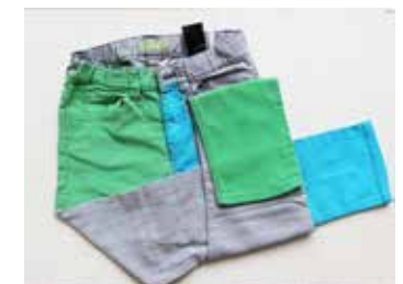
Créations des enfants pendant ce Parcours croisé