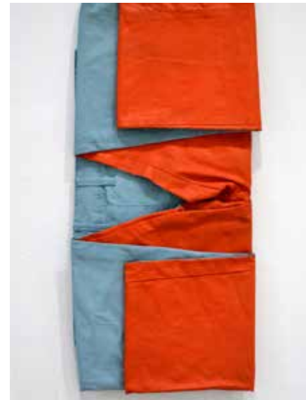
Jean-François Leroy Jean , 2017 tissus, peinture

Cet atelier a permis de découvrir une technique plastique que j'utilise au sein de mon travail mais également de transformer un objet fonctionnel du quotidien en une œuvre d'art. » J-F. L