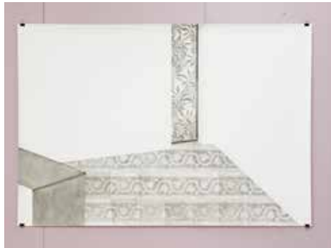
Stéphanie Nava, Feuilles dedans, dehors , 2016 fusain sur papier, 150 x 218 cm