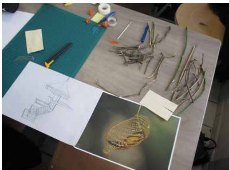
Vitry-sur-Seine en 2050 ?

L'équipe de l'Exploradôme les a initiés à Google sketchUp 3D pour modéliser leurs plans en 3D et ainsi obtenir une vue virtuelle de leur architecture. Cette dernière est venue se sur-imprimer au réel pour certains projets grâce à la réalité augmentée. Ces propositions offrent une vision futuriste et végétalisée de Vitry-sur-Seine.