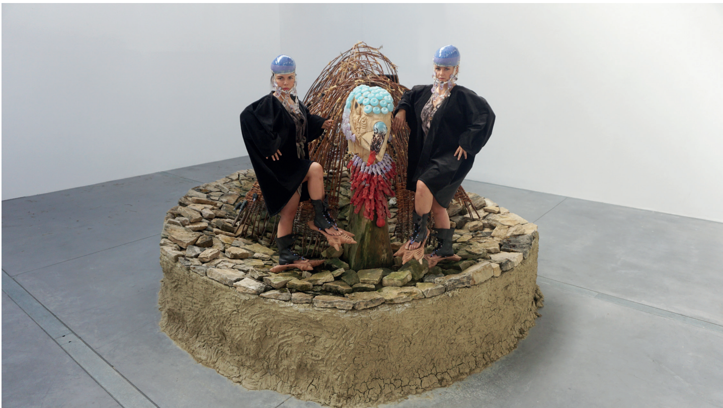
Triple Sommeil , Aurélie Ferruel et Florentine Guédon, 2020. Performance au Crac 19, Montbéliard © Aurélie Ferruel et Florentine Guédon