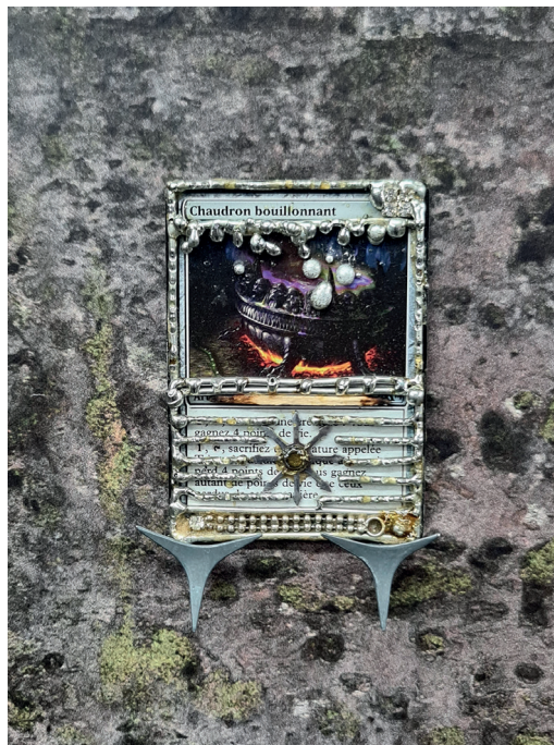
Chaudron bouillonnant, Yuri Johnson, 2022 Carte Magic, étain, bijou, 6,5 x 10 cm